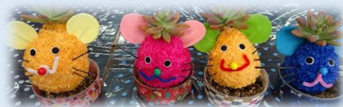
昨年度の講座作品